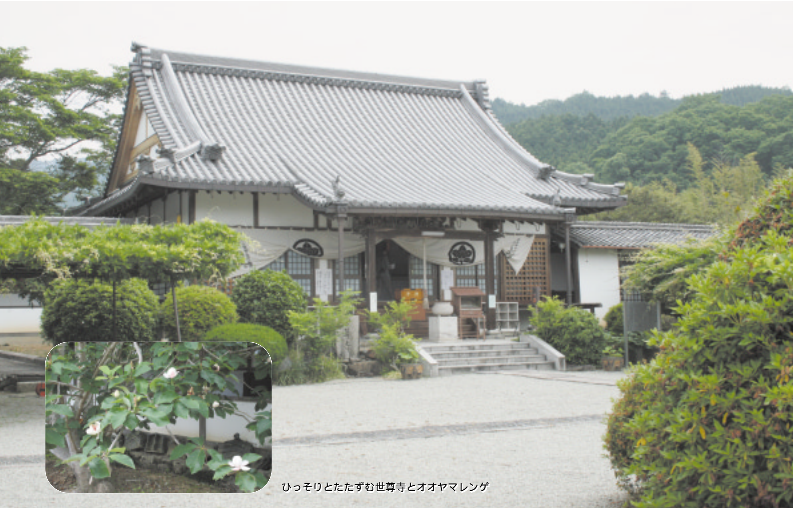
ひっそりとたたずむ世尊寺とオオヤマレンゲ

ホームページ(URL) ● http://www.shokoren-nara.or.jp