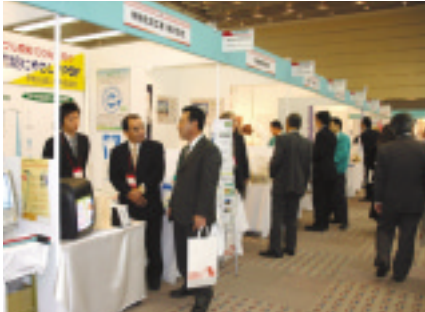
県内企業の出展ブースの様子

新規顧客の獲得と企業間交流を目指す第四回ビジネスフェア NANTO（南都銀行、同経済センター主催）が昨年十月二十七、二十八日の両日、大阪市中央区本町橋のマイドーム大阪で開催された。 同フェアは、「革新を現実」をテーマに、県内の電気、機械化学関連31社、健康、環境関連31社、生活関連35社、IT関連7社、その他大学・公的機関20機関の計124の企業等が出展参加した。製品や新技術などPRするとともに、新顧客、ビジネスパートナーなどを求めて活発な交流が行なわれた。 また、同フェアは大阪府の池田銀行のビジネスマッチングフ