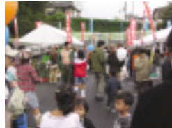
町民らでにぎわう会場