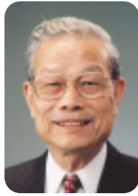
奈良県 柿本善也知事