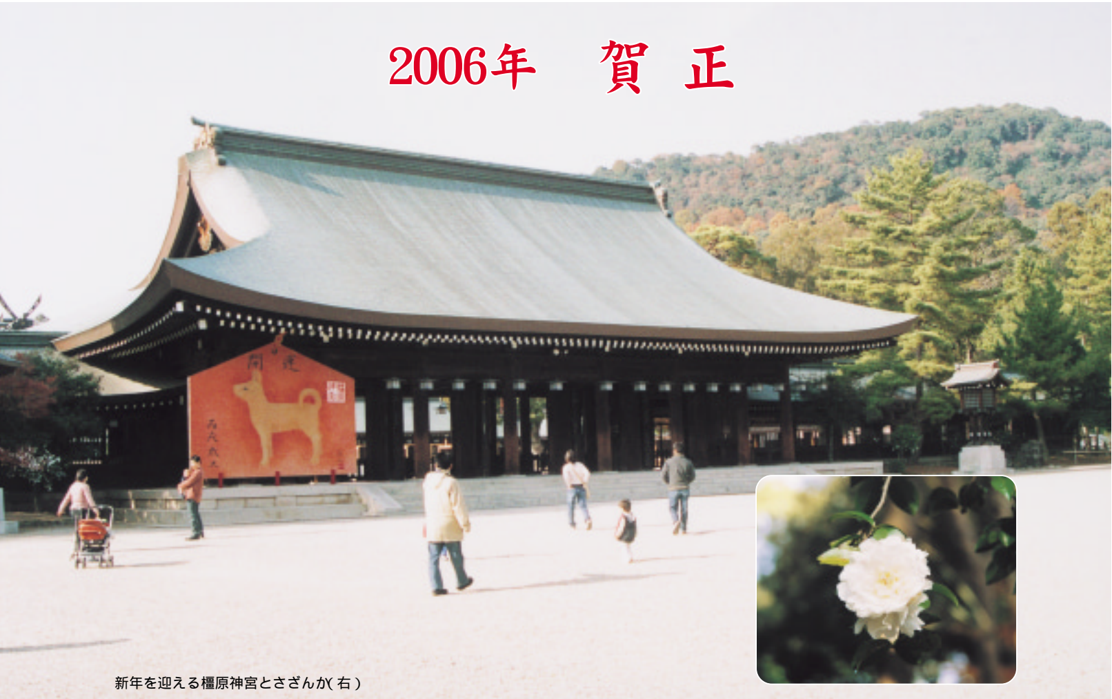
新年を迎える橿原神宮とさざんか(右)