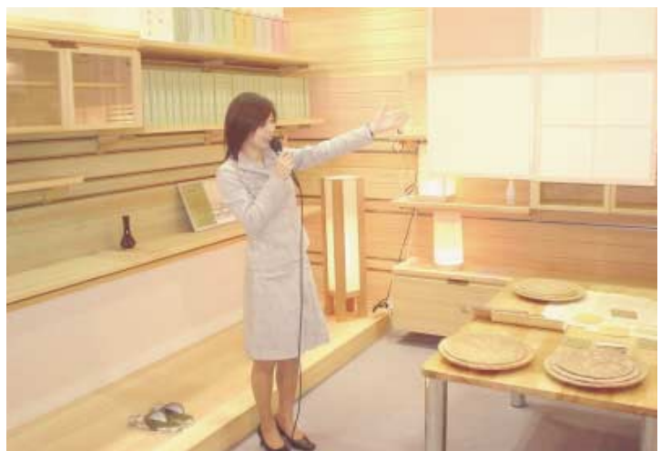
吉野の自然共生素材（ヨシノスタイル）のプレゼンテーション

とアルミなどの新素材を融合させた点、2番目は限られたスペースを有効活用できる機能を持つ点、3番目は使い手の健康志向ニーズを満たすことができる点などがあげられる。