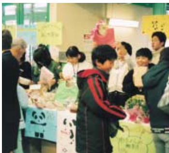
商品を「売る」体験をする小学生たち