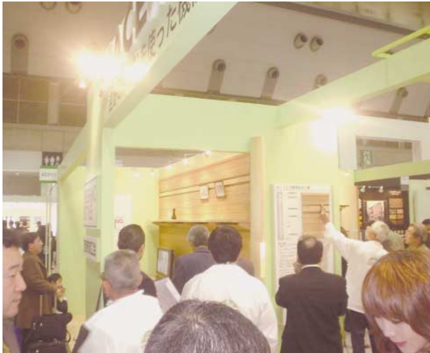
見学に訪れた建築関係者や見学者